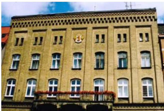
budynek straży pożarnej przy ulicy Grodzkiej

Więcej informacji o Szczecinie, a także na temat projektów realizowanych przez sedina.pl znajdziecie Państwo na portalu sedina.pl. O wszystkich wydarzeniach będziemy też informować w cyklicznych newsletterach.